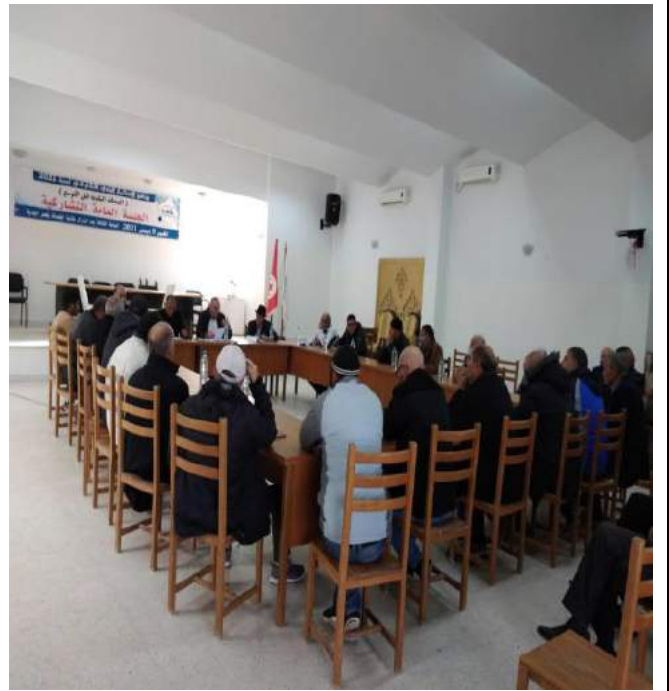
رئيس الجلسة السيد رئيس البلدية